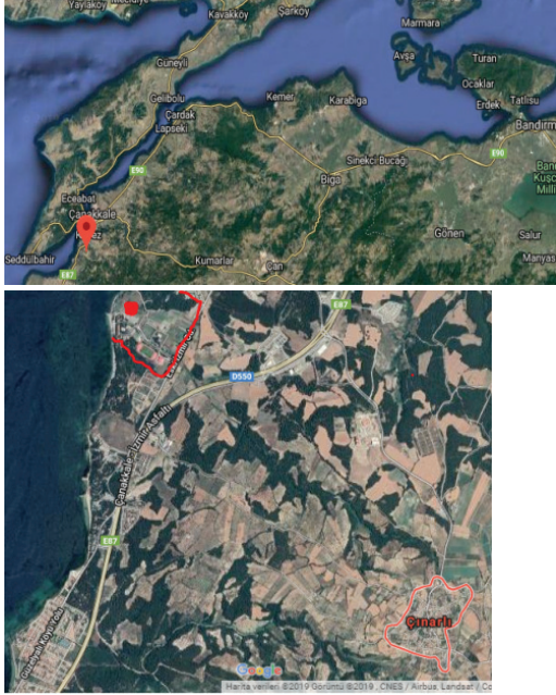
Şekil 2. Çınarlı Köyü, ÇOMU Dardanos Yerleşkesinin Konumu ve Sınırı [Goggle Earth 2019]'dan yararlanılarak.