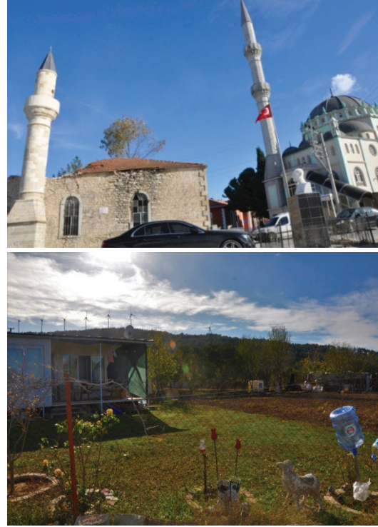
Şekil 3. Çınarlı Köy Meydanı ve Rüzgar Tribünleri (2019).

Köyün temel geçim kaynağı tarımsal ürünler, orman ürünleri ve hayvancılıktır. Köyde küçük ve büyükbaş hayvancılık yapılmaktadır ve süt birliği ile ürünler değerlendirilmektedir. Ayrıca bölge kente çok yakın olduğundan hobi bahçesi olarak kullanılan bahçeler vardır. Köy sınırında, tepelerin üstündeki rüzgar tribünleri karakteristik bir görüntü oluşturmaktadır ve elektrik üretimi yapılmaktadır (Şekil 3). Köyün içme suyu ve kanalizasyon şebekesi vardır. PTT şubesi, hizmet eden sağlık ocağı ve sağlık evi vardır. Alt yapısı genel olarak iyi olan köye ulaşım, asfalt yol ile yapılır. Elektrik, içme suyu ve sabit telefon vardır. Köye merkezden yarım saate bir kalkan dolmuşlar düzenli ulaşımı sağlar. Köy halkı turizme karşı çok açık görüşlü olup alanda kamp, konaklama olanağı ve restoran vardır. Köyde ilköğretim okulu vardır.