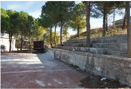
Şekil 6. Oyun Alanı ve Amfi Tiyatro (2019).