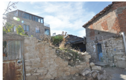
Şekil 4. Köyde Yeni ve Eski Yapılar (2019).