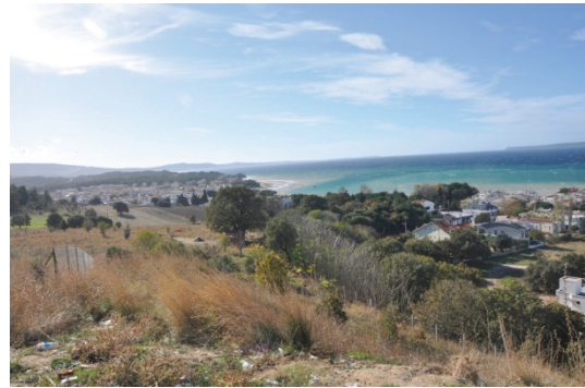
Şekil 10. Dardanos Yazlık Siteleri Bölgesi

Dardanos yazlık evleri ve siteleri bu bölgenin sahil kesiminde kurulmuştur. Bölgeye günümüzde doğal gaz getirilmiştir ve alt yapısı tamamlanmıştır. Böylece yaz-kış çok tercih edilmektedir (Şekil 10). Hasan Mevsuf Şehitliği bu bölgenin girişinde yer almaktadır. Şehitliğin olduğu bölge buraya gelen kişiler tarafından piknik amacı ile de kontrolsüz bir şekilde kullanılmaktadır ve çevre kirliliği çok fazladır.