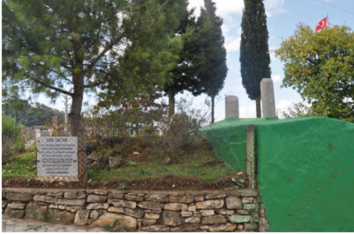
Şekil 5. Sarı Saltuk Türbesi (2017)

Köyün üst kısmında, Horasan erenlerinden Sarı Saltuk'un mezarı vardır ve türbe görünümündedir. Esas adı Muhammet Buhari olup, 1200-1300 yıllarında yaşamış büyük alim olup, Ahmet Yesevi tarafından 700 kişi derviş gazi ile Anadolu'da Hacı bayram Veli'ye yardıma gönderilmiş evliya büyüklerinden olması ile anılmaktadır (Şekil 4).