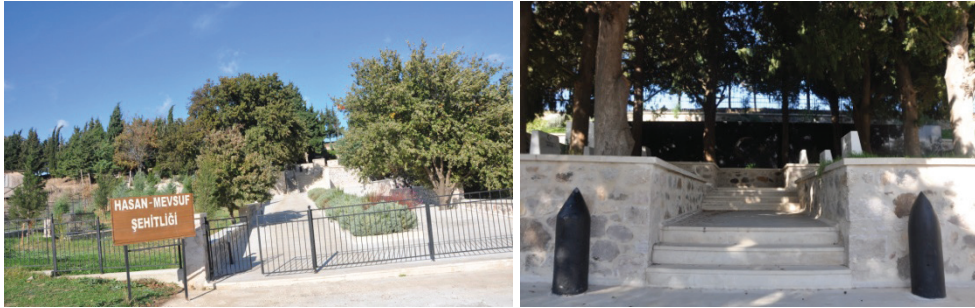
Şekil 9. Hasan Mevsuf Şehitliği (2019).

Dardanos yazlık evleri ve siteleri bu bölgenin sahil kesiminde kurulmuştur. Bölgeye günümüzde doğal gaz getirilmiştir ve alt yapısı tamamlanmıştır. Böylece yaz-kış çok tercih edilmektedir (Şekil 10). Hasan Mevsuf Şehitliği bu bölgenin girişinde yer almaktadır. Şehitliğin olduğu bölge buraya gelen kişiler tarafından piknik amacı ile de kontrolsüz bir şekilde kullanılmaktadır ve çevre kirliliği çok fazladır.