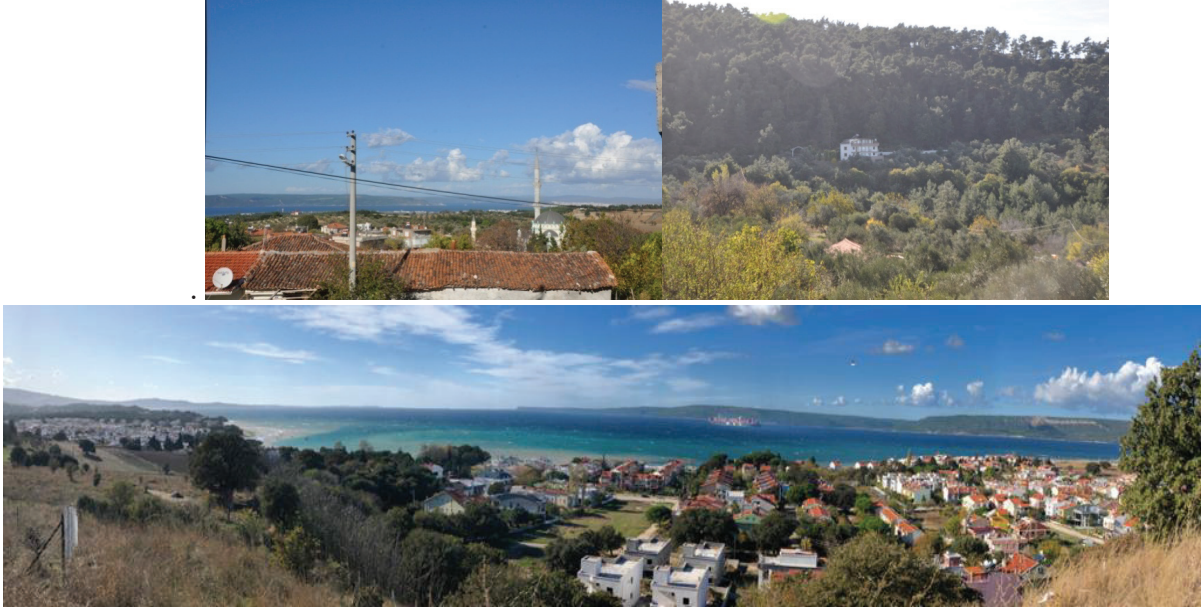
Şekil 1. Çınarlı Köyünden Çanakkale Boğazının Görünüşü, Köy Ormanlık Alanı ve Sahili

Turizm sektörünün, mekanizasyona ve otomasyona girme imkanı oldukça sınırlı olduğundan istihdam yoğunluğu diğer sektörlerle oranla çok daha yüksektir. Turistik tüketim harcamaları, sektörde emek-yoğun üretimin hakim olması, mal ve hizmet veren yan sektörlerde yeni iş imkanları sağlayarak indirekt istihdam etkisi yaratması Çanakkale ekonomisi için önemli bir unsurdur [2]. Çalışma alanının, kent merkezine çok yakın olması istihdam açısından olanağını artıran bir faktördür.