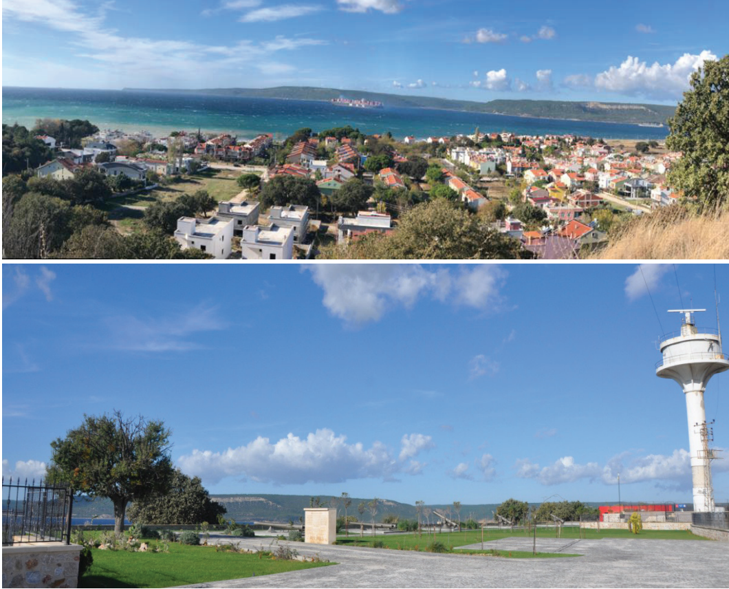
Şekil 8. . Hasan Mevsuf Bataryası'nın Konumu (2019)