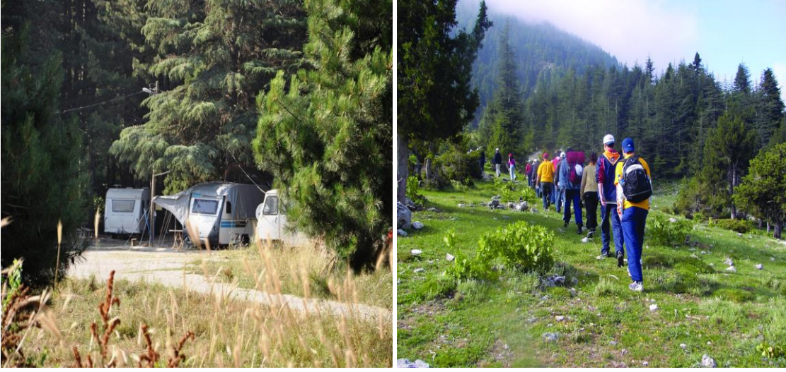
Resim 5,6. Başkonuş Ekoturizm Alanındaki Kamp Alanlarından Görüntüler