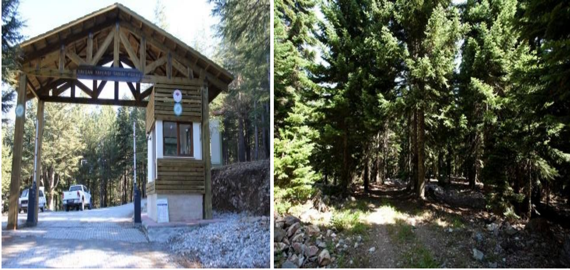
Resim 7,8. Yavşan Tabiat Parkının Girişinden Görüntüler

Yavşan yaylası ülkemizde doğal olarak yetişen ağaç türlerinde Toros Göknaarının kuzey yarımküredeki yayılış alanının en doğusunu oluşturur. Ayrıca Lübnan Sedirinin saf ve karışık en güzel meşcerelerinin bulunması nedeniyle Türkiye'nin en doğal ve güzel yerlerinden birisidir [17].