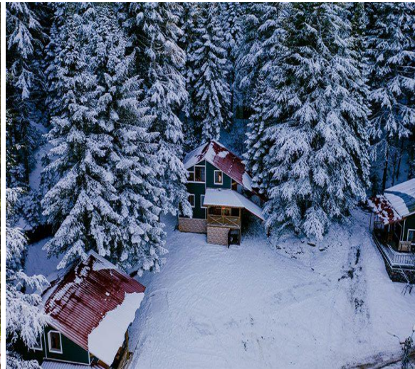
Resim 3,4. Başkonuş Ekoturizm Alanındaki Bungalov Evlerinden Görüntüler