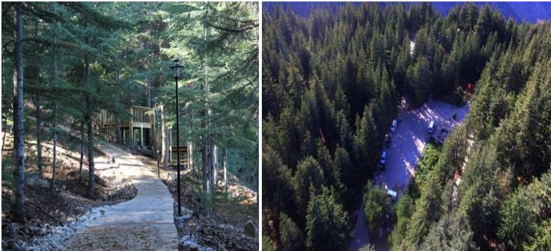
Resim 9,10. Yavşan Tabiat Parkının Ormanlık Alanından Görüntüler