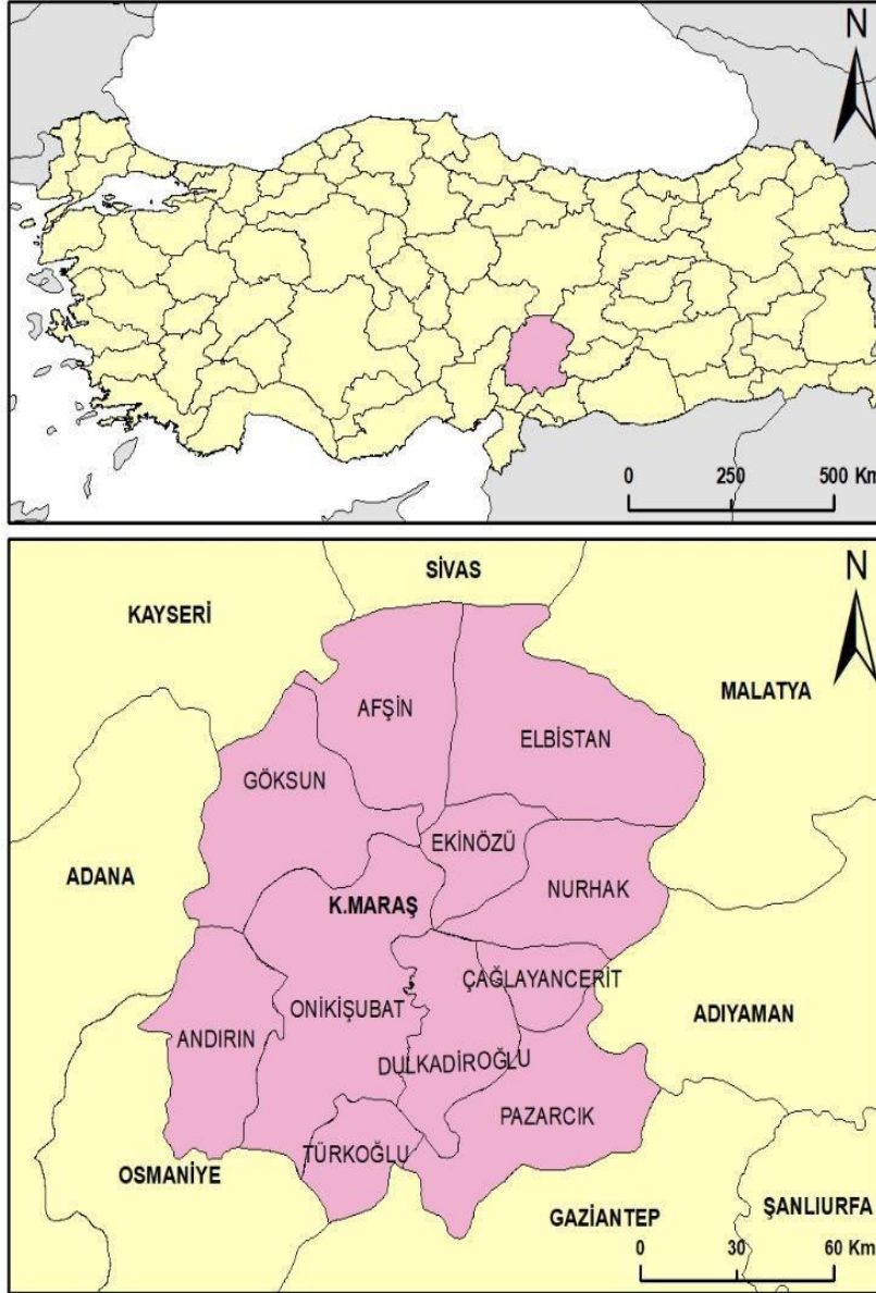
Şekil 1. Araştırma Alanının Lokasyon Haritası

Kahramanmaraş Türkiye'nin, 14.327 km 2 'lik yüzölçümü ile 11. nüfusa göre 18. büyük ilidir. Topraklarının %59,7'si dağlarla, %24'ü plato ve yaylalarla %16,3'ü ovalarla kaplıdır. Deniz seviyesinden 568 m. yüksekte olup, ilin kuzey kesimleri oldukça dağlıktır. Yeryüzü şekilleri genellikle Güneydoğu Toroslar'ın uzantıları olan dağlardan ve bunlar arasında kalan çöküntü ovalardan oluşmuştur. Kahramanmaraş dağlarının yüksek kesimleri genellikle çıplak kayalıklardan oluşmaktadır. Alt kuşaklar orman dokusu ile örtülüdür.