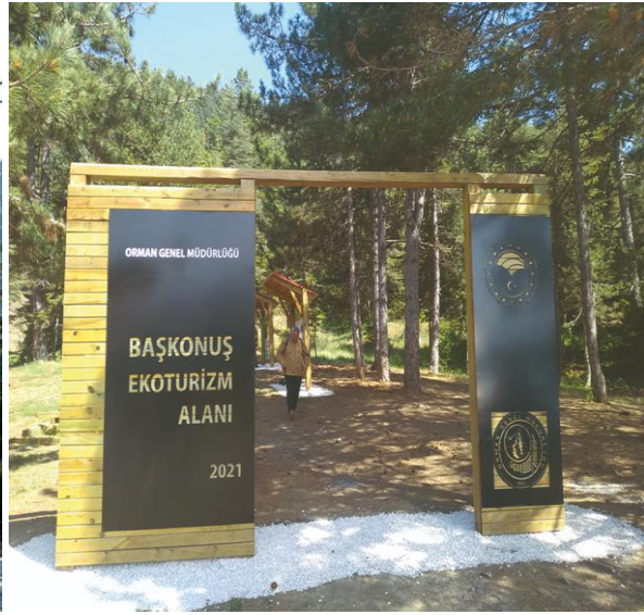
Resim1,2. Başkonuş Eko-turizm Alanının Girişinden Görüntüler