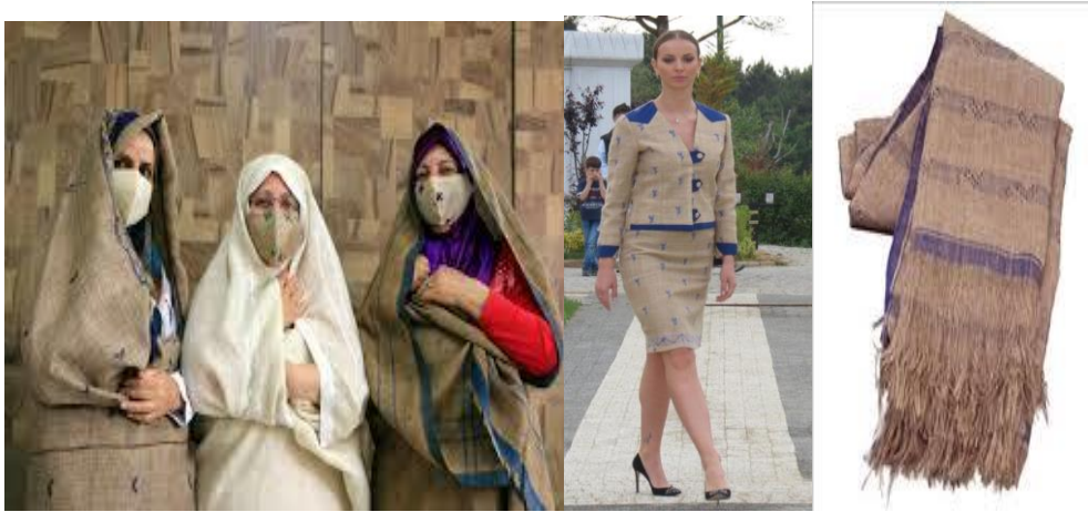
Şekil 3. Güncellenerek ticarileştirme: Erzurum geleneksel dokuması Ebrahimin güncellenerek ticarileştirilmesi

Belirli kurallar çerçevesinde, günlük yaşantıda yeri ve değeri olacak şekilde ticarileştirme en uzun ve güvenilir bir yoldur. Burada dikkat edilecek husus özünü bozmadan, dejenerasyona müsaade etmeden kimliğini muhafaza ederek mal, ürün ya da hizmetin güncellenerek geliştirilmesi esas alınmalıdır. Günümüzde kimlik kazandırmada kayıt altına almak, belgelendirmek ve bunu yaparken de kurumsal kimliği olan devlet ve ilgili kurumların onayını almak çok önemlidir. Çünkü bu değerli olanın muhafazasını kolaylaştırır. Geçmişin belgelendirilmesinde Türkiye’de bazı kuruluşlar vardır. Örneğin Patent ve Marka Kurumu gibi. Coğrafi işaret, ata tohumu belgesi bu işlemlerden birkaç tanesidir. Patent kurumu yöresel ürün çerçevesinde bu güne kadar Türkiye’de binlerce ürüne belge vermiştir. Coğrafi işaretler fikri mülkiyet haklarının kapsamına girmektedir. Coğrafi İşaret ; bir ülke, bölge ya da sınırları belli bir alan ile özdeşleşmiş, ününü ve kalite özelliklerini söz konusu alandan alan ürünleri belirten işaret olarak tanımlanmaktadır (WTO 2014). Coğrafi İşaret, yaşanmış binlerce yıllık bir birikimin ürüne dönüşmüş ve gelenekselleştirilmiş halidir. Coğrafi işaretler, geleneksel bilginin bir ürünle şekillendirilip satıldığı şeklidir; ürünün kalitesi, geleneksel üretim metodu ve coğrafi kaynağı arasında kurulan bağı simgeleyen bir güvencedir(Şekil 3).