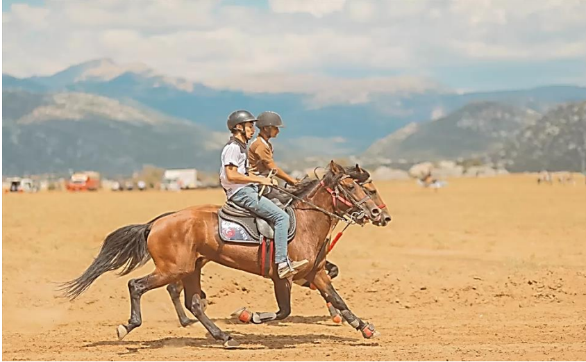
Şekil 2. Geleneksel Rahvan at yarışı

sürdürmeye çalışmaktadır. Yörük-Türkmen kültürünün yakın geçmişte var olan giyim kuşamı (üç etek, kuşak vb.) , hayvancılığı ve buna bağlı yaylacılığı yanında yetiştirdiği alim ve devlet adamları, tüccarları ile ve de at ve diğer çiftlik hayvanları (Koyun-Keçi ve Büyükbaş) yetiştiriciliği bakımından ileri olduğu da bilinmektedir. Evlerin planı ise, çok amaçlı ortak alan, ısıtmanın ortada yer alması Türk evi kurgusunun göçebe kültüründen etkilendiğinin kanıtıdır.